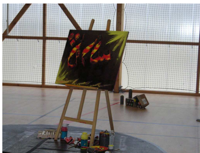
Ce tableau veut exprimer l'harmonie et l'équilibre.

Les danseurs expriment l'amour, la haine et la violence. La musique change à chaque sentiment.