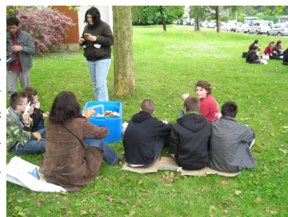
Le pique nique

A midi, nous avons mangé un pique nique dehors devant l'établissement.